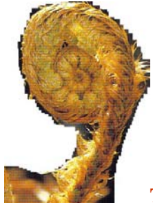
TEST 1- COSTRUZIONE DI SPIRALE